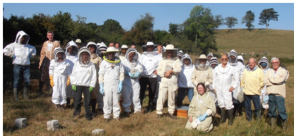
Les nouveaux apiculteurs de 2020

Les Faidides 63590 CUNLHAT - www.lerucherdulivradois.com